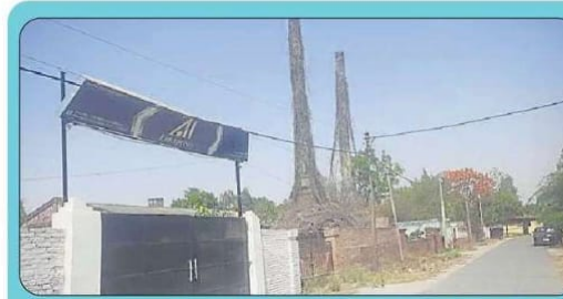
The chimney of an old ceramic factory that has shut in the industrial area of Phulpur. New factories are being established in the area. SOURCED