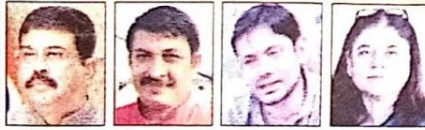
धर्मेन्द्र प्रधान मनोज तिवारी कन्हैया कुमार मेनका गांधी