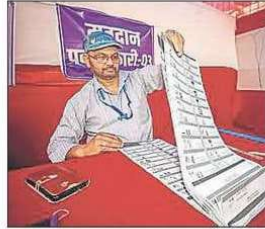
A polling official on duty in Patna on May 22.

"I did not have resources to set up polling agents... As such I urge you to give me scanned or physical copies of Form 17C Part I, 'Accounts of Votes